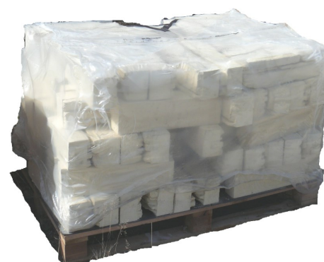
Palette de blocs muret