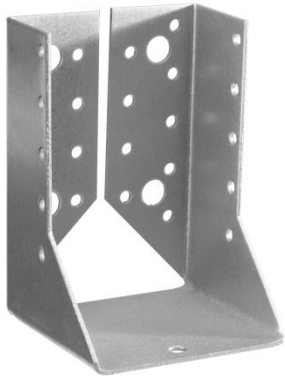
Sabot de charpente à ailes intérieures