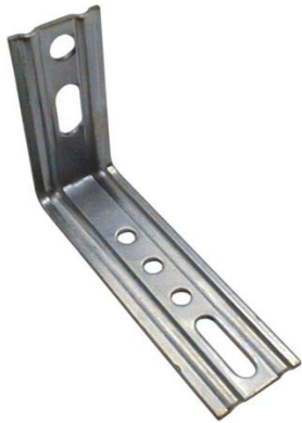
Équerre menuiserie 2 pans