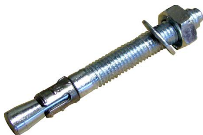
Goujon fileté FT