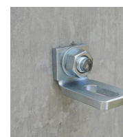
Goujon fileté FT - vue en situation