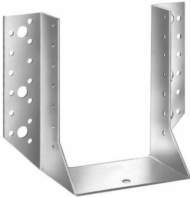
Sabot de charpente à ailes extérieures